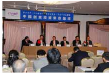
专家组讨论 Panel Discussion