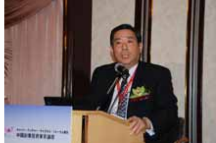
主题演讲 Keynote speech