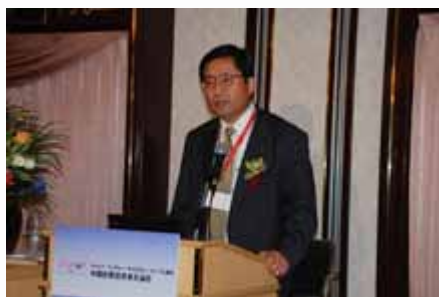
主题演讲 Keynote speech