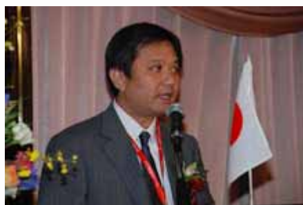
主题演讲 Keynote Speech