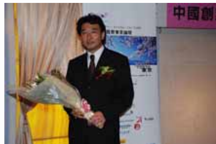
颁奖典礼 awarding ceremony