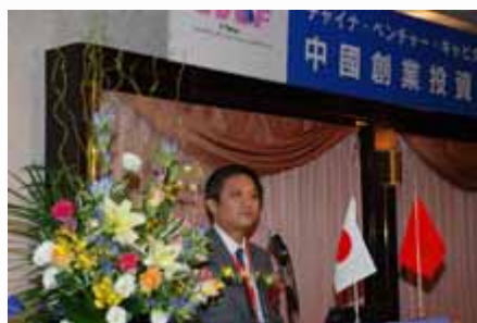
主题演讲 Keynote Speech