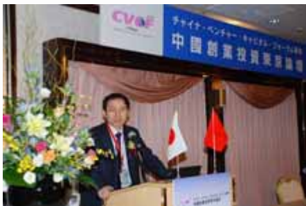
主题演讲 Keynote Speech