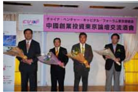
颁奖典礼 awarding ceremony