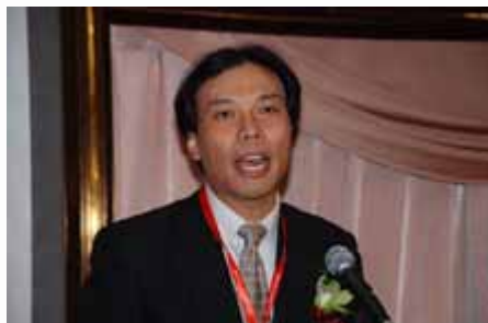
主题演讲 Keynote speech