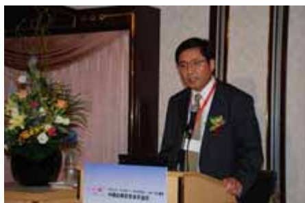
主题演讲 Keynote speech