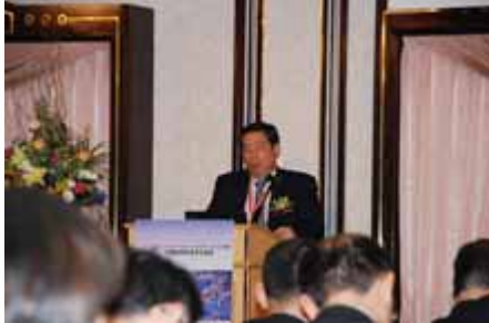
主题演讲 北尾吉孝, SBI, 董事长 CEO Yoshitaka Kitao, SBI, Representative Director CEO

Keynote speech 3: How to find a future global first-class enterprise in China?