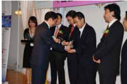
颁奖典礼 awarding ceremony