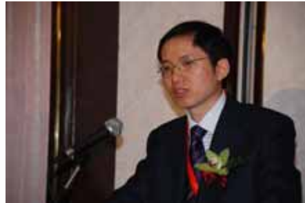
主题演讲 Keynote Speech