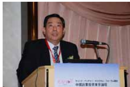
主题演讲 Keynote speech