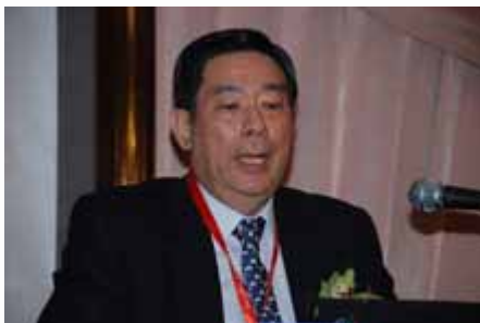
主题演讲 Keynote speech