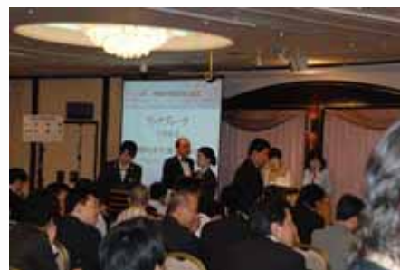
商务午餐 Speech during lunch