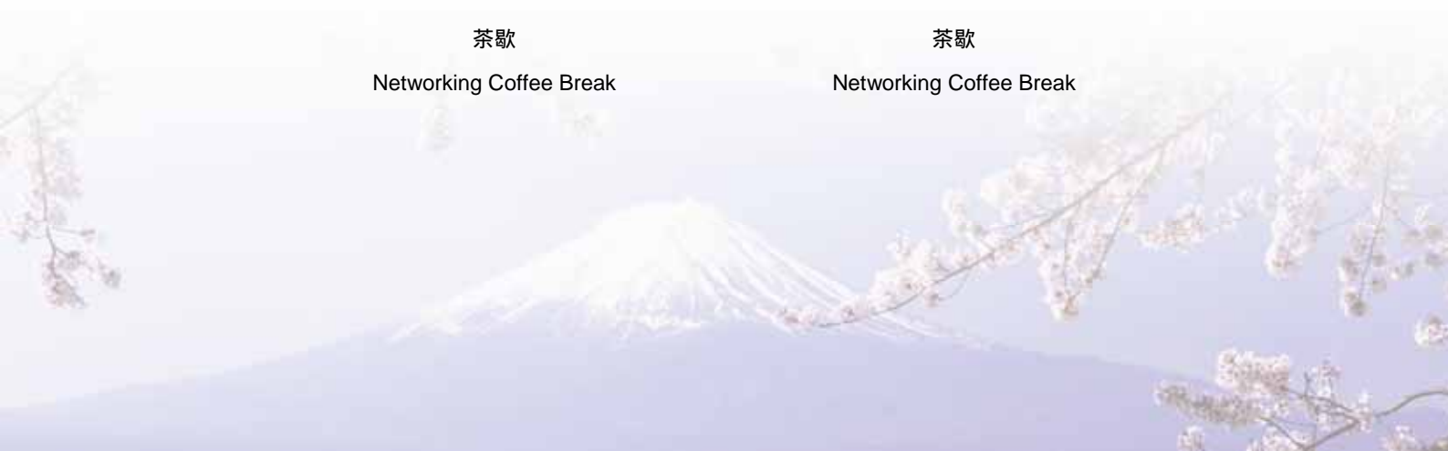
Networking Coffee Break