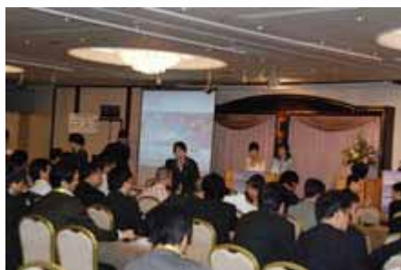
商务午餐 Speech during lunch