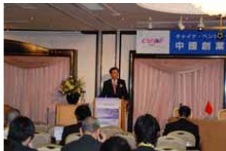
主题演讲 Keynote speech