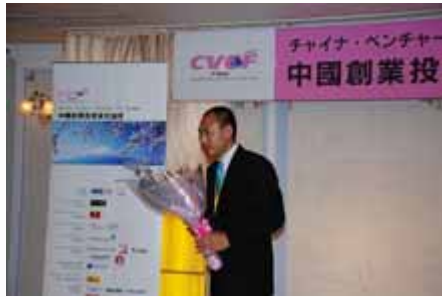
颁奖典礼 awarding ceremony