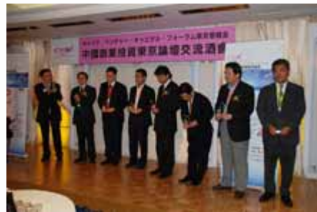
颁奖典礼 awarding ceremony