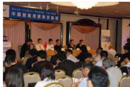
专家组讨论 Panel Discussion