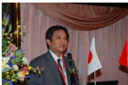
主题演讲 Keynote Speech