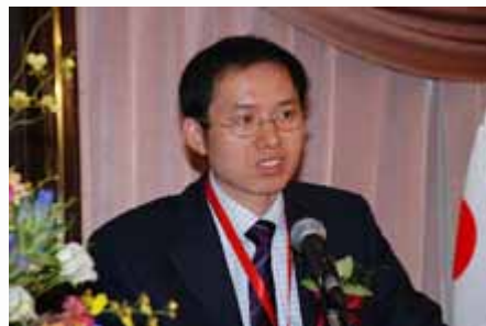
主题演讲 Keynote Speech