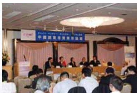
专家组讨论 Panel Discussion