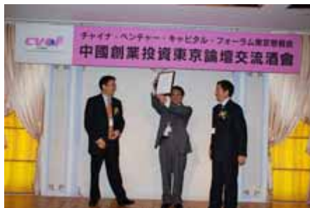
颁奖典礼 awarding ceremony