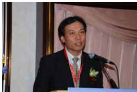
主题演讲 Keynote speech