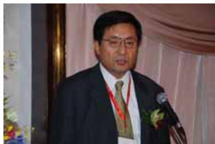
主题演讲 Keynote speech