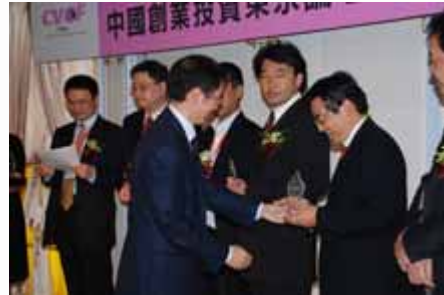
颁奖典礼 awarding ceremony