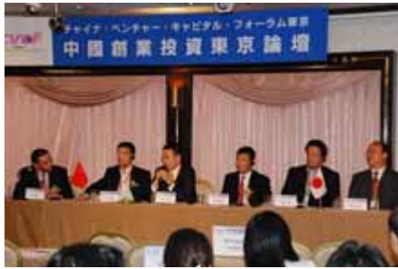
专家组讨论 Panel Discussion