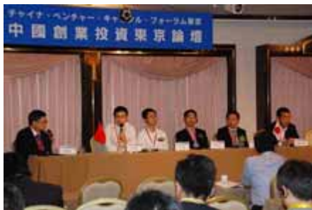
专家组讨论 Panel Discussion