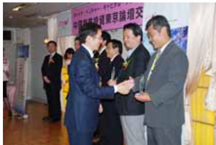
颁奖典礼 awarding ceremony